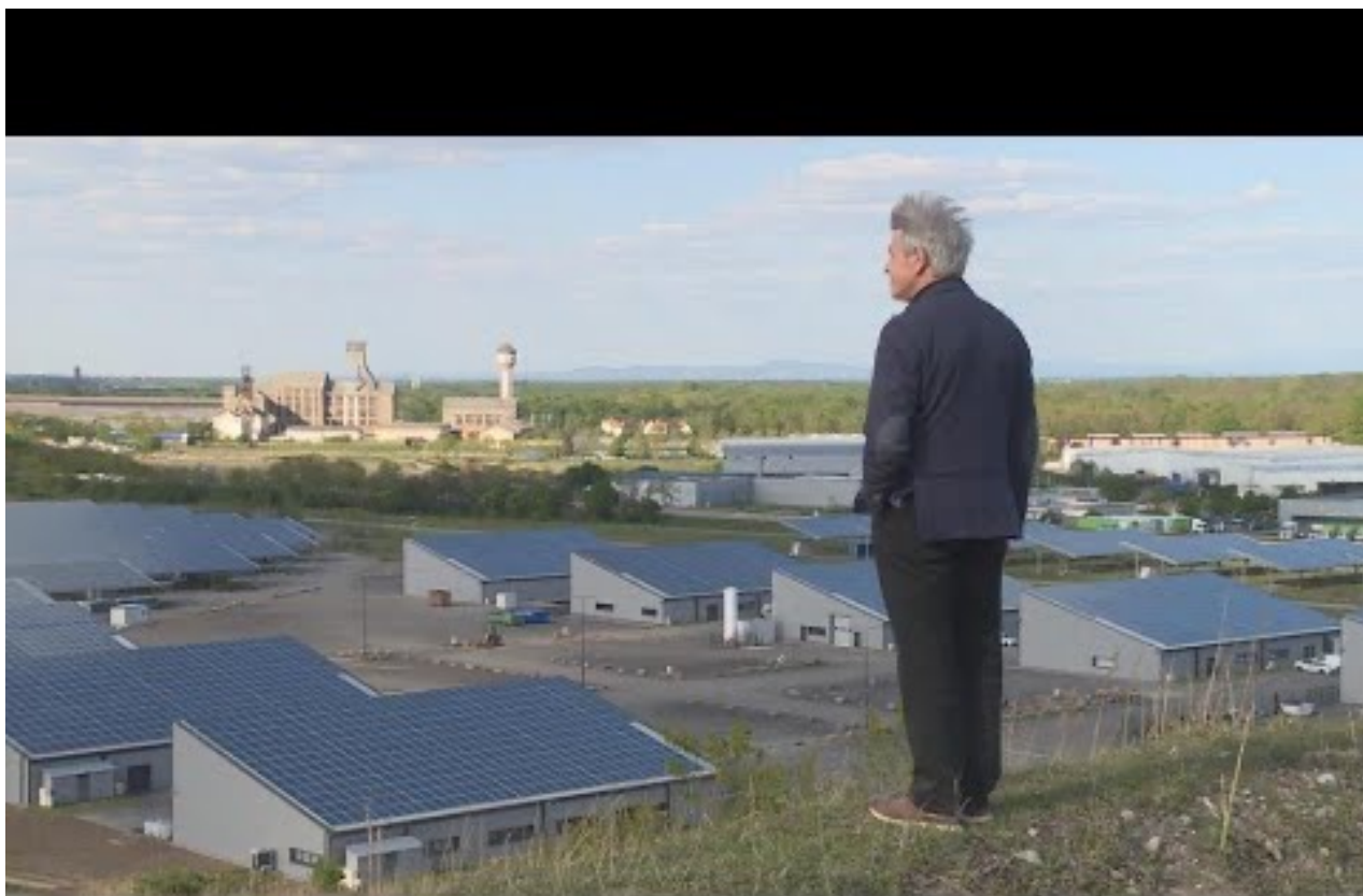
Vidéo de 5'24 Le village d'Ungersheim, en Alsace, pionnier de la transition écologique vidéo de 5'07 Voir aussi Loos en Gohelle, pionnière également Des trucs de bobos écolos pas de chez nous ou du bon sens paysan ?